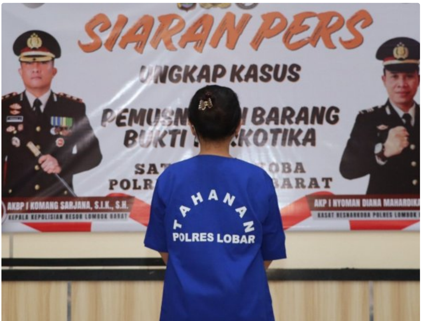
Terduga yang diamankan oleh Sat Resnarkoba Polresta Mataram,.

Lombok Barat NTB - Sat Resnarkoba Polres Lombok Barat berhasil mengamankan pelaku serta Barang bukti Sabu dalam pengungkapan kasus Narkotika di wilayah Hukum Polres Lombok Barat pada 5 Oktober 2024 di Areal